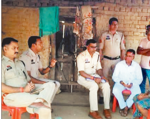
मामले की जांच करने पहुंची पुलिस टीम।