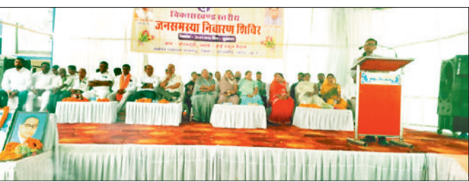
कार्यक्रम में उपस्थित ग्रामीणों को संबोधित करते अतिथि।

ग्राम चोरभट्टी के हाई स्कूल मैदान में विकासखण्ड स्तरीय जनसमस्या निवारण शिविर आयोजित किया गया। शिविर में 75 आवेदन पत्र निराकृत किए गए। शासन के विभिन्न महत्वाकांक्षी योजनाओं की प्रभावी क्रियान्वयन एवं विभागों की संतुष्टिकरण के लिए विकासखण्ड पामगढ़ क्षेत्र अंतर्गत ग्राम चोरभट्टी में हाई स्कूल मैदान में शुक्रवार 20 मार्च को विकासखण्ड स्तरीय जनसमस्या निवारण शिविर आयोजित किया गया। उक्त शिविर में कुल 135 प्राप्त आवेदनों में से 75 आवेदनों का शिविर स्थल में नियमानुसार निराकरण किया गया तथा शेष 60 आवेदनों को एक सप्ताह के भीतर नियमानुसार निराकरण किये जाने