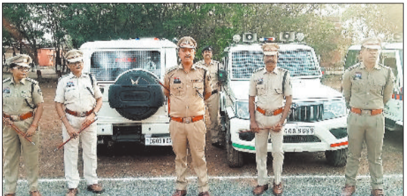
वाहनों में लगाए जा रहे लोहे की जाली।