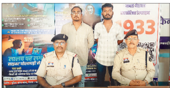
हरिभूमि न्यूज | चांपा

घर अंदर घुसकर मारपीट करने वाले दो आरोपियों को पुलिस ने गिरफ्तार कर न्यायिक रिमांड पर भेज दिया है। मामला चांपा थाना क्षेत्र का है।