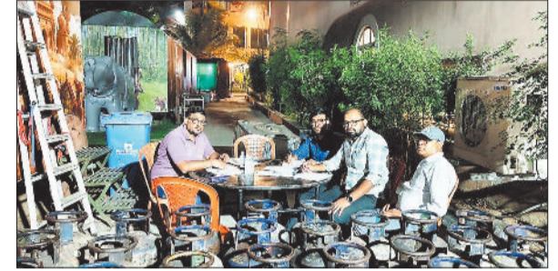
सिलेंडरों की जबती बनाते अफसर।